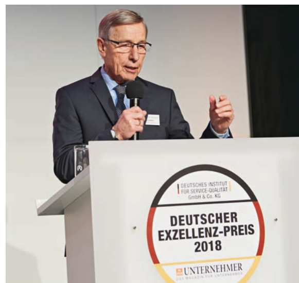
Schirmherr: Wolfgang Clement würdigt in seiner Rede die herausragenden Leistungen der Preisträger

In sieben Kategorien konnten Deutschlands innovativste Start-ups den Deutschen Exzellenz-Preis entgegennehmen. Neben Fintechs finden sich darunter auch Gewinner aus der Immobilien- oder der Softwarebranche.